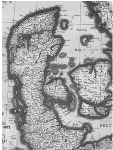
Kort fra Erik Ejegods tid.

Og så er det nærliggende at tro, at han har 'lovet Gud' at bygge en kirke der, hvor han gik i land.